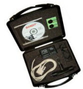
BANDIT Software & Schnittstelle für 240 PB

Wenn Sie über keine Einbruchmeldetechnik verfügen, oder BANDIT als Einzelanwendung betreiben möchten, empfehlen wir Ihnen unser Modell 240 PB mit PC Schnittstelle, eingebauten Sirenen und Funkfernbedienung. An diesem Modell können zur Alarmauslösung Bewegungsmelder, Magnetkontakte und Zubehör direkt angeschlossen werden.