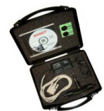
BANDIT Software & Schnittstelle für 240 PB

Wenn Sie über keine Einbruchmeldetechnik verfügen, oder BANDIT als Einzelanwendung betreiben möchten, empfehlen wir Ihnen unser Model 240 PB mit PC Schnittstelle, eingebauten Sirenen und Funkfernbedienung. An diesem Modell können zur Alarmauslösung Bewegungsmelder und Magnetkontakte und Zubehör direkt angeschlossen werden.