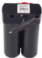
HY-3 Tank mit Multitool