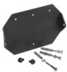
Montagehalter 240 06 002