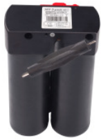
HY-3 Tank mit Multitool