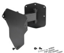
Montagehalter 240 06 004