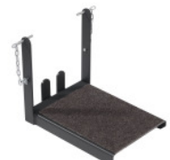
Montagehilfe 240 06 020